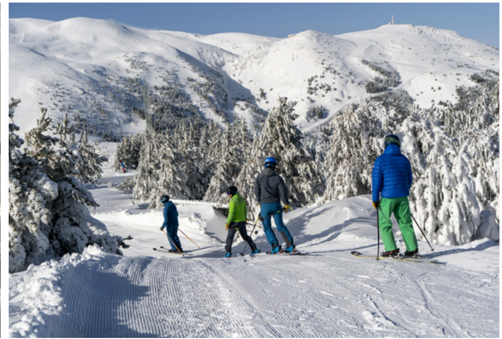
Oriol Molas FCC