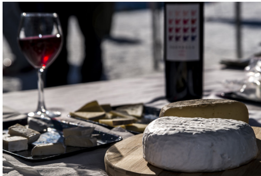
Felipe Valladares ©FGC