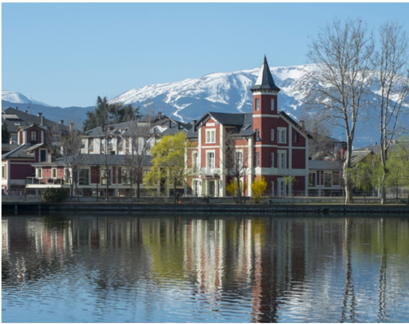
Inmedia Solutions ©ACT