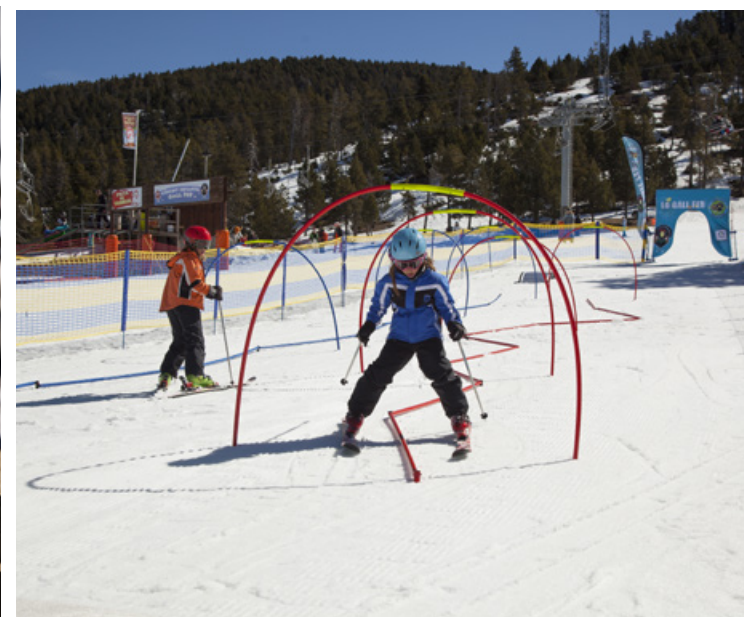
Felipe Valladares ©FGC