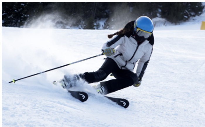
Tom Grasas ©FCC