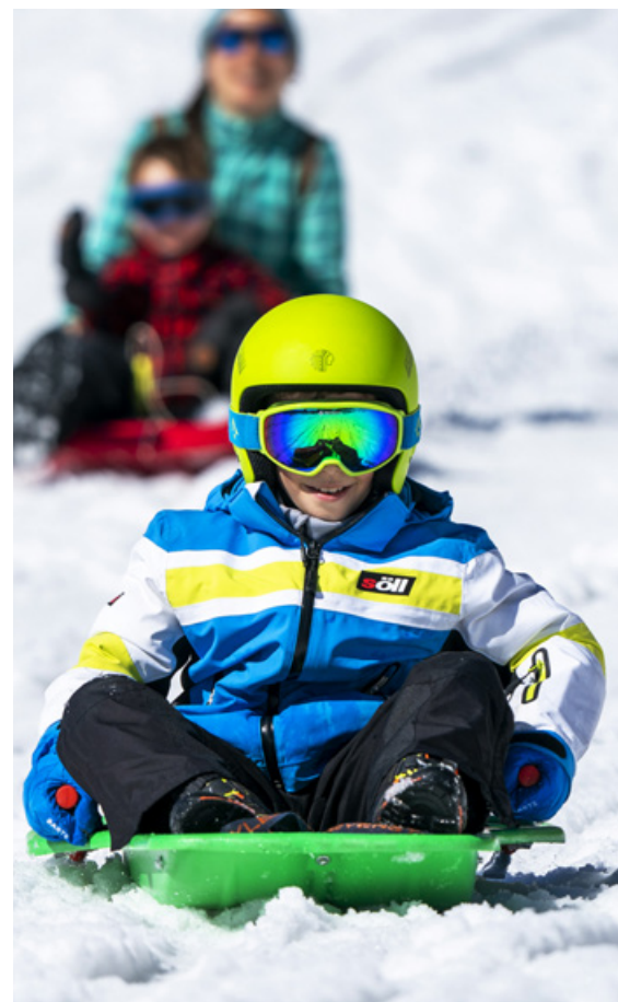
Ofel Molas ©FCC